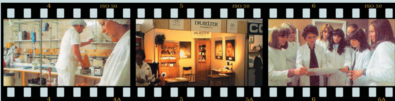
Das erste Labor – schon damals ein Zeichen für Qualität und Sicherheit.