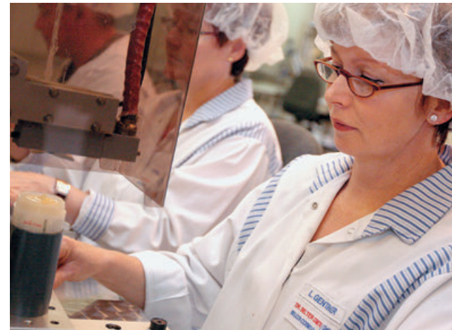
Auch seinen engagierten Mitarbeitern ist Dr. Belter Cosmetic zu großem Dank verpflichtet.